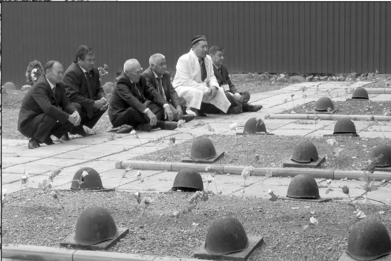
Делегация Казахстана на месте погребения воинов-казахстанцев из 100 и 101 отдельных стрелковых бригад в с. Молодой Туд Оленинского района Тверской области.

Завел товарищи, дорогие друзья Надеюсь, труд ваш и труд защиты то пр са за На ко по р- м с д