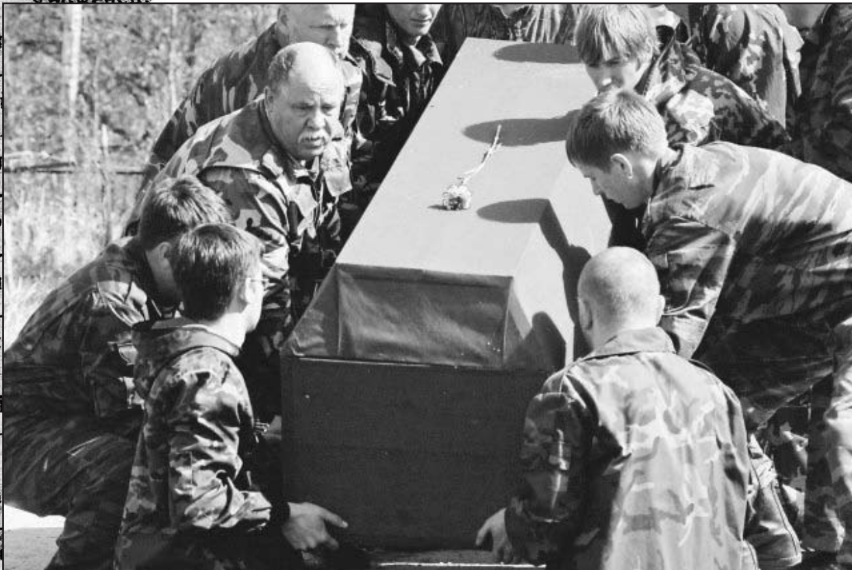
Захоронение найденных воинов в с. Чудской Бор Тосненского района Ленинградской области. Межрегиональная поисковая экспедиция «Любань». 10.05.2009 г.