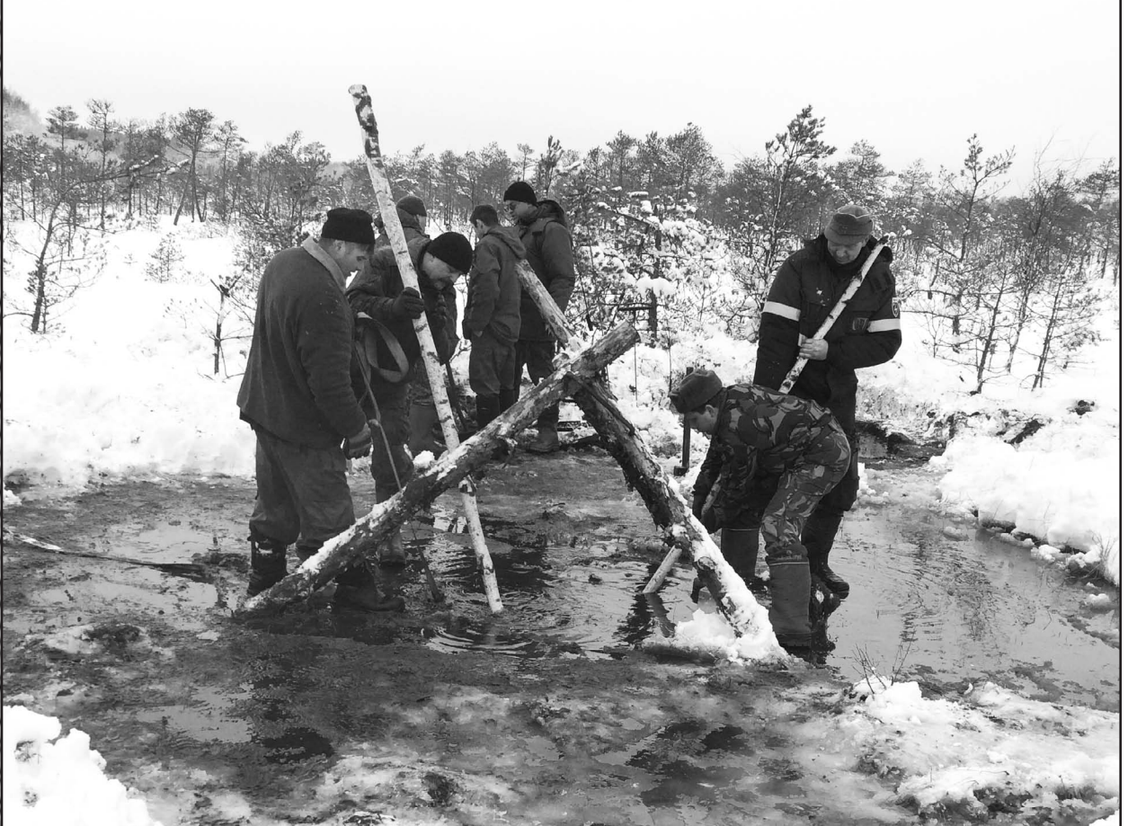
Подъем обломков самолета для использования в реставрационных работах по восстановлению бомбардировщика Пе-2 в рамках проектов «Небо Родины» и «Крылья Татарстана». Болото Сучан, Парфинский район Новгородской области. 2017 г.