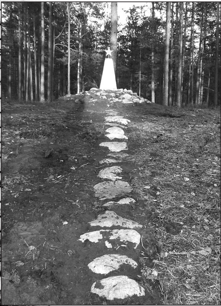
«Дорожку от памятника выложили к склону сопки вниз в направлении болота, где всё ещё лежат ненайденные наши бойцы 1246 сп — для них дорожка, чтобы рано или поздно они взяли эту высоту!» Болото Гладкое у урочища Карбусель, Кировский район Ленинградской области. 2016 г.