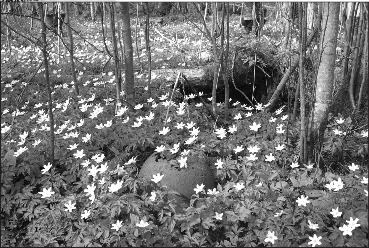
«В Мясном Бору сейчас так тихо, Цветут подснежники, весна.»

Республика _____ Край _____ Область _____ Город _____ Район _____ С/совет _____ Деревня _____ Фамилия _____ Республика _____