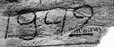
Эксгумация останков советских воинов в д.Альт-Тухебанд, земля Бранденбург, Германия. 2016 г.