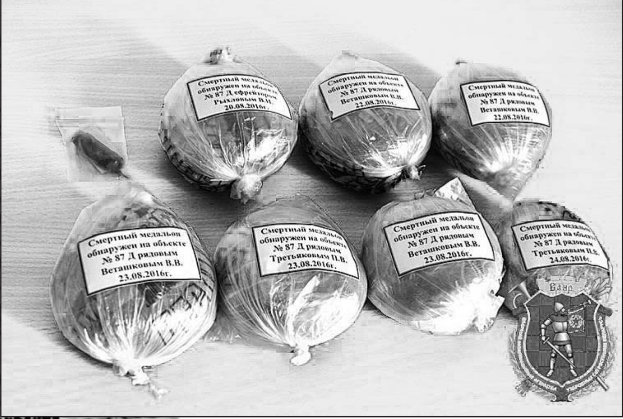
Медальоны подготовлены к отправке на экспертизу. 52-й отдельный специализированный поисковый батальон Вооруженных сил Республики Беларусь. г.Борисов. 2016 г.

Республика _____ Край _____ Область _____ Город _____ Район _____ С/совет _____ Деревня _____ Каким РВК мобилизован _____ Группа крови _____ " на Янскому _____